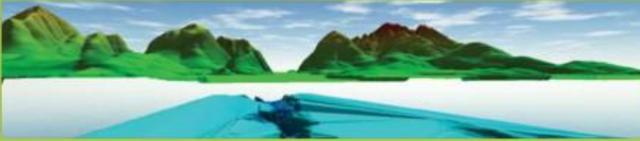
3B Görünümde birden çok yüzeyin görüntülenmesi

Bu özelleştirilebilir eğik görünüm, tam ekran görünümünde veya ilgili 2D haritayla yan yana yerleştirilmiş olarak gerçekçi bir perspektif sunar. 3B görünümü bir görüntü dosyası veya bir uçuş videosu olarak kaydetme imkanı sunar.